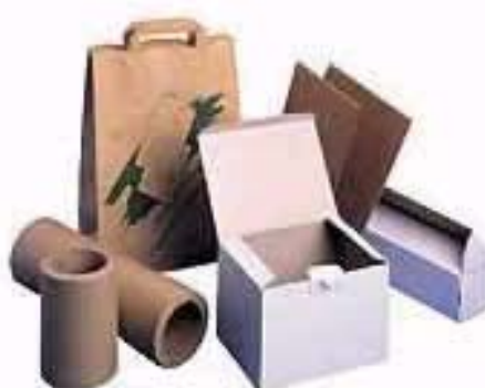
Figuur 3 Enkele producten gemaakt uit papier gerecycled uit drankenkartons dat vervangen wordt door energetisch gebruik van PE

De methodes hieronder beschrijven verschillen vooral in het soort brandstof.