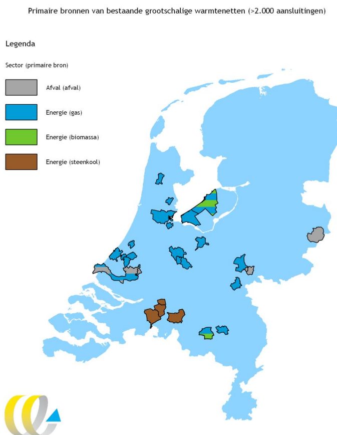
Figuur 1 Overzicht bestaande grootschalige restwarmtenetten en primaire bron

In Figuur 1 zijn de gemeentegrenzen van de reeds bestaande grootschalige warmtenetten (> 2.000 aansluiting) weergegeven inclusief de leverende sector en primaire bron. Uit Figuur 1 blijkt dat het overgrote deel van deze warmtenetten is aangesloten op energiecentrales die als primaire bron aardgas hebben. In de Bijlage A staat het overzicht van deze warmtenetten met meer specifieke kenmerken.