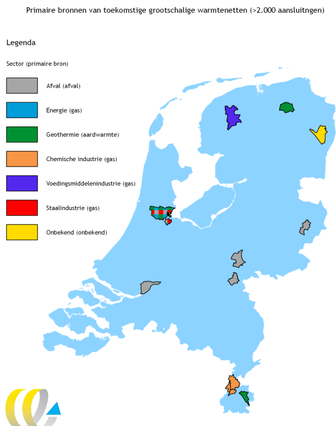
Figuur 2 Overzicht toekomstige de grootschalige restwarmtenetten en primaire bron

In Figuur 2 zijn de gemeentegrenzen van de toekomstige 1 grootschalige warmtenetten (> 2.000 aansluiting) weergegeven, zover nu bekend, inclusief de leverende sector en primaire bron. Meerdere warmtenetten worden op afvalverbrandingsinstallaties aangesloten. In de Bijlage A staat het overzicht van deze warmtenetten met meer specifieke kenmerken.