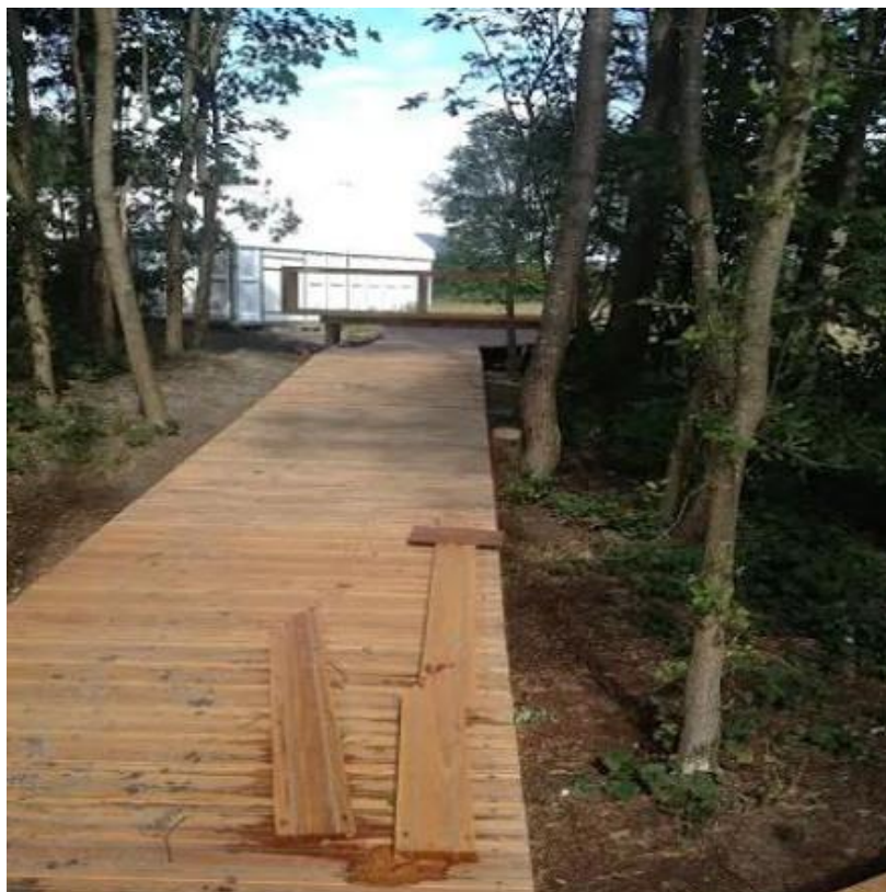
Figuur 2 - vlonderplanken hout